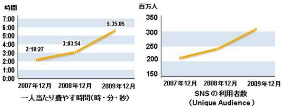
(図1) ソーシャル・ネットワーキング・サイト(SNS) 世界主要10カ国の利用状況

* 世界10カ国: アメリカ, イギリス, オーストラリア, ブラジル, 日本, スイス, ドイツ, フランス, スペイン, イタリア